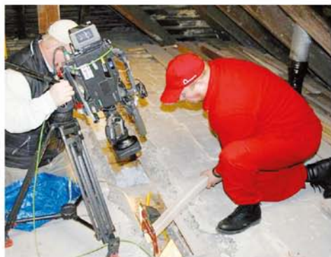
Při natáčení pořadu Rady ptáka loskutáka - zateplení dutiny trámového stropu

Pokud by existoval způsob, jak ušetřit 30% za topení, tak by ho jistě každý majitel domu rád znal. Dobrá zpráva je, že to jde. Řešení je již na světě a opravdu to funguje. Přesvědčili se o tom majitelé již více než 12 tisíc objektů u nás. Když si představíme dům, kde za topení vydáváme kolem 35 tisíc ročně, tak dokážeme každý rok ušetřit až 10 tisíc korun.