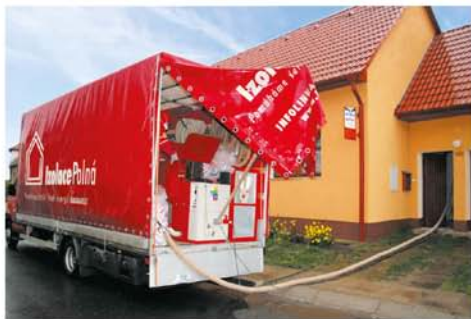
Foukání izolace hadicí z vozu před domem

Představte si, že sedíte pohodlně v obýváku, koukáte oblíbený film a než skončí, máte hotovo. Stačí 3 hodiny a šetříte také. Bez námahy, bez nepořádku a v super kvalitě. Nehádate se s řemeslníky, nastavíte lešení, neuklízíte nepořádek. Je to možné? Ano. Když si vyberete zkušené machry, kteří službu zdokonalují mnoho let. Ti mají cenné zkušenosti a chtějí klientovi upřímně pomoci, ne ho okrást a prodat mu podřadné produkty, co nakoupí někde z druhé ruky.