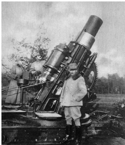
(30,5 cm mozdíř vz. 16 - výrobek Škody Plzeň)

chtěla obsadit rakouský (tedy i „náš“) přístav Terst prakticky až do konce války. Tamní střety byly nepředstavitelně kruté a v mnohém předčily zvěrstva druhé světové války.