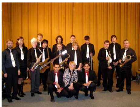
Koncert tanečního orchestru ZUŠ Jedovnice (16. listopadu)