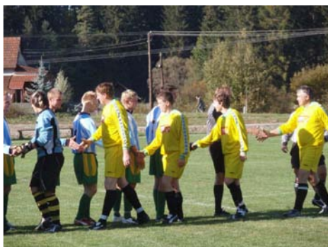
Nedělní zápasy našich fotbalistů