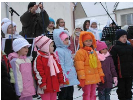
Slavnostní rozsvěcování vánočního stromu (29. listopadu)