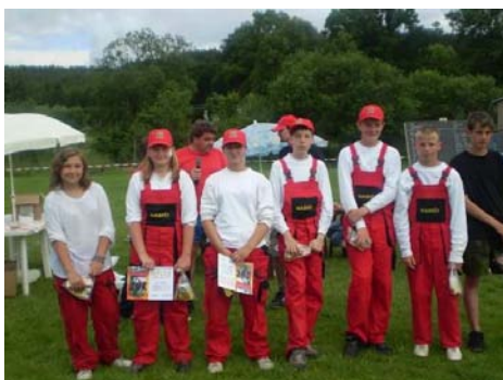
120. výročí založení SDH Ostrov (21. června)