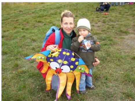
Drakiáda (12. října)