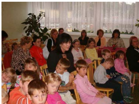
50. výročí založení mateřské školy (17. září)