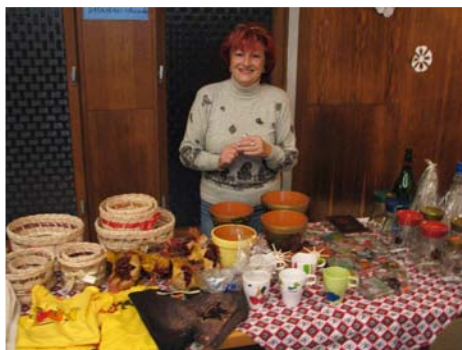
Vánoční výstava (29. listopadu)