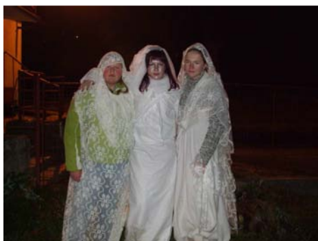
Hejkalova stezka (15. listopadu)