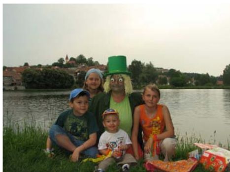
Den dětí (1. června)