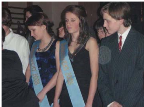
Tradiční ples SRPDŠ (1. února)