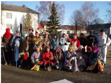
Masopust (3. února)