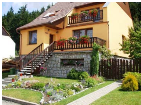
Soutěž o nejlepší vzhled předzahrádek